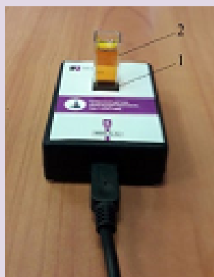
Рис. 1. Датчик оптической плотности: 1 — мезадо для кюветы; 2 — кювета для исследуемого вещества

Датчик температуры платиновый — простой и надёжный датчик, предназначен для измерения температуры в водных растворах и в газовых средах. Имеет различный диапазон измерений от -40 до +180 °С. Технические характеристики датчика указаны в инструкции по эксплуатации.