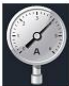
Рис. 2. Датчик абсолютного давления