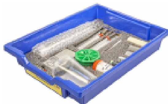
Набор № 1

Комплект сопутствующих элементов для экспериментов по механике (рис. 4).