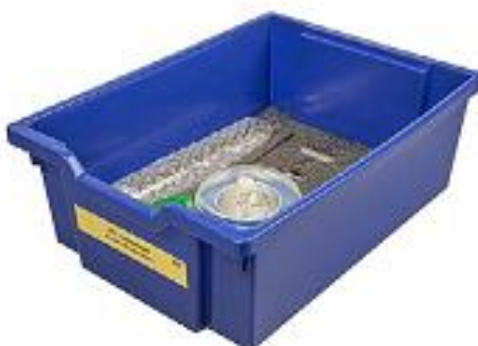
Рис. 5. Комплект сопутствующих элементов для экспериментов по молекулярной физике

Комплект сопутствующих элементов для экспериментов по молекулярной физике (рис. 5).