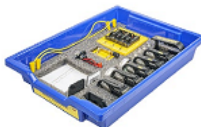
Рис. 7. Комплект сопутствующих элементов для экспериментов по оптике

Комплект сопутствующих элементов для экспериментов по оптике (рис. 7).