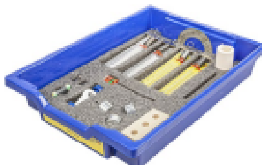
Набор № 2