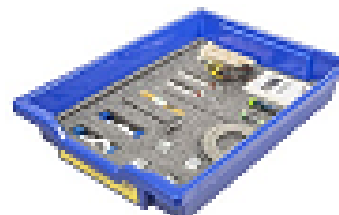
Набор № 4