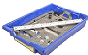
Набор № 3