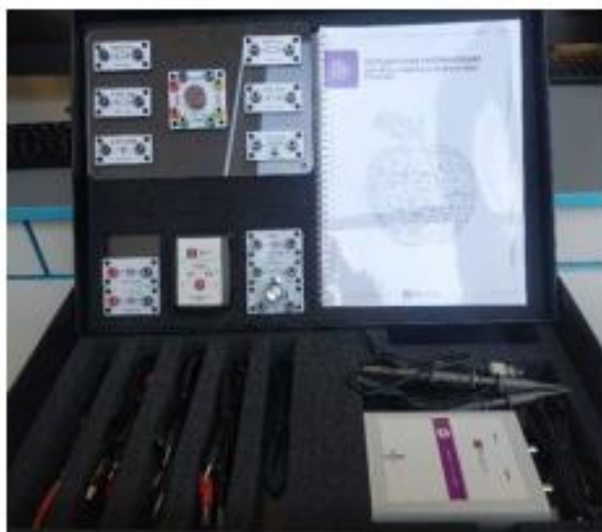
Рис. 1. Цифровая лаборатория по физике

Датчик (рис. 2) производит измерения абсолютного давления. Чувствительный элемент датчика выполнен на базе монолитного кремниевого пьезорезистора с внедрённой тензорезистивной структурой, которая позволяет исключить возможные погрешности и достигнуть необходимой точности измерений. В комплект датчика абсолютного давления входит гибкая герметичная трубка для подключения штуцера датчика к лабораторному оборудованию.