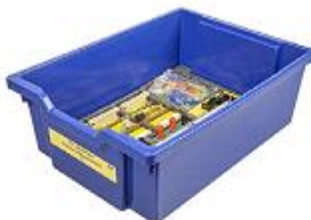
Рис. 6. Комплект сопутствующих элементов для экспериментов по электродинамике

Комплект сопутствующих элементов для экспериментов по электродинамике (рис. 6).